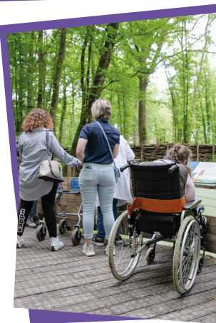
**sur présentation de la Carte Mobilité Inclusion

Nous proposons par ailleurs un tarif réduit pour les personnes en situation de handicap** (PSH), afin de favoriser l'accès de toutes et tous à nos sorties : l'accessibilité est une des valeurs phares du Parc. Notre guide a suivi une formation dédiée, dispensée par APF France Handicap. La richesse du territoire doit pouvoir être appréciée par le plus grand nombre sans barrière liée à la condition physique !