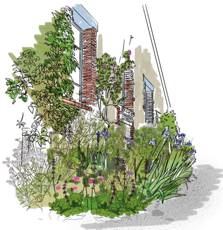
Dessins du guide des essences végétales - Massifs et vivaces - ©Coline Caillier

Comment fleurir son jardin et les abords de sa maison de manière pérenne ? Comment assurer le renouvellement ou l'augmentation du fleurissement de sa commune de manière économique, avec des plantes locales ? Pour répondre à ces questions, le Parc vous propose un nouveau guide gratuit sur les plantes vivaces et la conception des massifs !