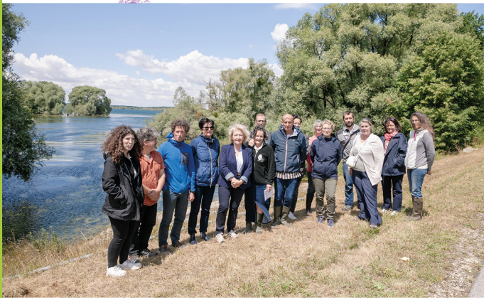
Visite des rapporteurs de l'autorité environnementale, le 8 juillet 2025

Pour le Parc naturel régional de la Forêt d'Orient, la fin de la saison estivale aura été placée sous le signe de la continuité dans le processus de révision de la Charte. En effet, suite à la visite de l'autorité environnementale, nos équipes, les élus, ont pris le soin de répondre point par point aux recommandations de l'autorité. Leurs conclusions sont bienveillantes et ils ont