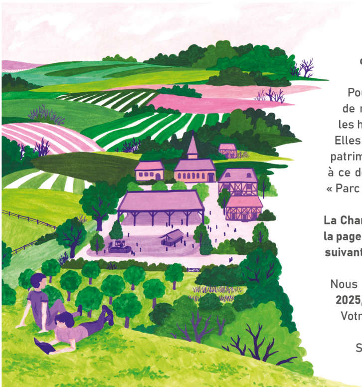
▲ Dessin des patrimoines du PNRFO, par l'illustratrice Mona Leu-Leu