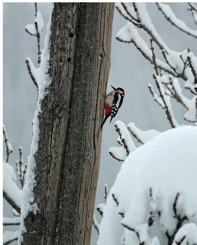
▲ Pic épeiche sur du vieux bois