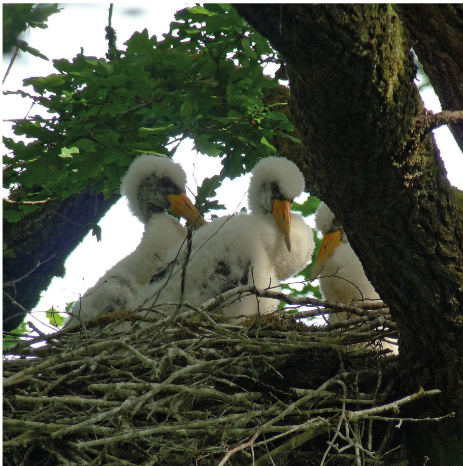
Les cigogneaux dans leur nid

Sa présence dans le secteur était suspectée depuis quelques temps par l'ONF. Durant un inventaire forestier en mars, un nid est découvert ! Le garde de la Réserve naturelle nationale de la Forêt d'Orient, prévenu, constate le