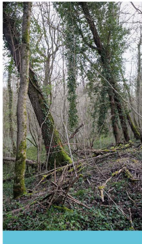
Îlot de libre évolution forestière

Le 13 juillet, elle fera étape dans l'Aube ! Son trajet débutera à Ervy-le-Châtel, puis elle passera par Nogent-sur-Seine, Ville-sous-la-Ferté, Romilly-sur-Seine, Dolancourt et Mesnil-Saint-Père, avant de gagner Troyes. Ne manquez pas les animations prévues localement pour accompagner son parcours !