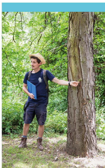
Sortie guidée par Clément Leclercq