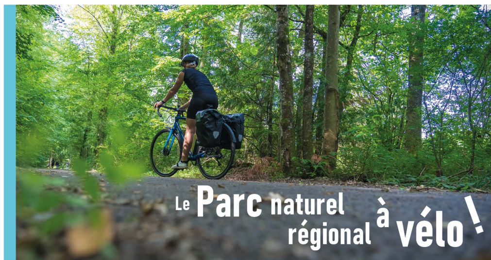
La Voie verte des Grands Lacs Seine et Aube

C et été, le vélo est mis à l'honneur dans le Parc : après le passage de la course Paris-Troyes le 20 mai, c'est la 9 e étape du Tour de France qui le traversera le 7 juillet ! Ces deux grands événements cyclistes sont aussi l'occasion de revenir sur la place des moyens de déplacement « doux » au sein du Parc, qui cherche à les valoriser.