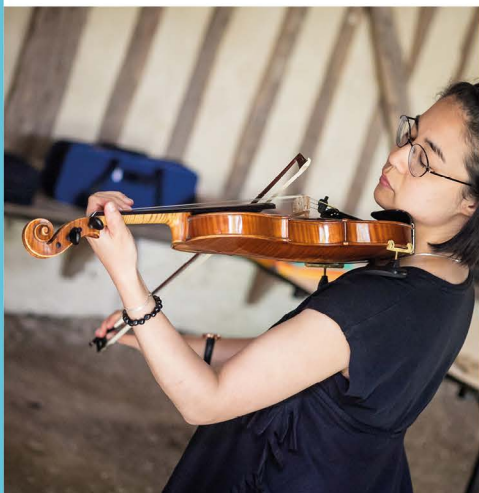
Ateliers d'initiation au violon et au violoncelle à la Maison du Parc en 2023

D u 17 au 20 juillet, le Festival des Lacs d'Orient en Champagne revient pour sa 8 e édition !