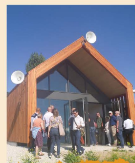
Centre de secours de Géraudot, avec structure en béton-chanvre

Déjà réalisée sur plusieurs exploitations du Parc, la culture de cette plante a de beaux jours devant elle !