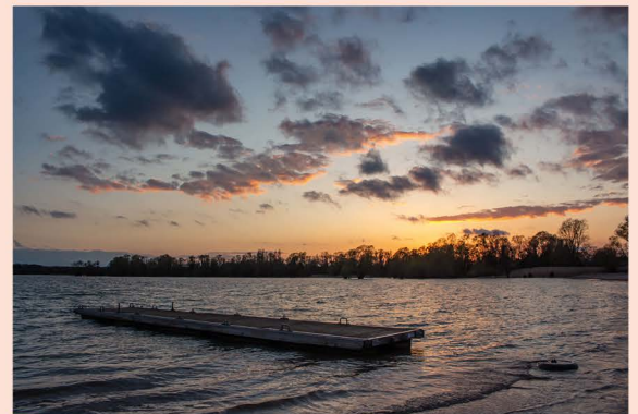
1 er prix « paysage » Stéphanie GAUZA