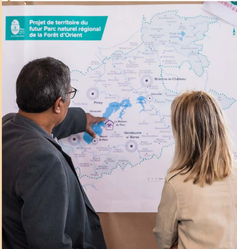
Présentation du projet de territoire du futur PnrFO lors des 1 ères Rencontres du Parc, 10 septembre 2022