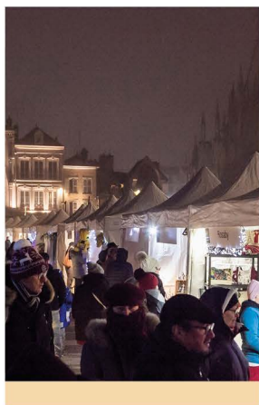
Marché de Noël du Parc en décembre 2022

Le marché de Noël du Parc revient les 15, 16 et 17 décembre sur la place de la Libération à Troyes !