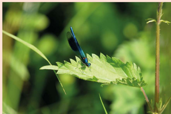
Prix « jeunes » (moins de 18 ans) Esteban LEFEVRE

Les gagnants seront exposés au Festival de Montier en novembre (voir ci-contre) !