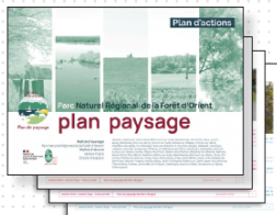
Le livrable papier

Rappel des documents de rendu de l'étude :