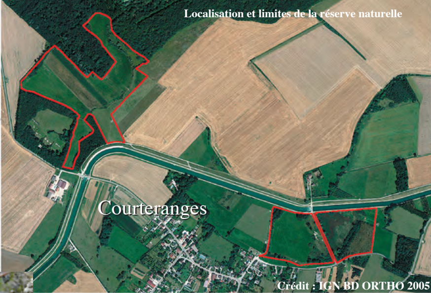
Localisation et limites de la réserve naturelle

La gestion agricole des parcelles, par fauche tardive après le 14 juillet (8) ou par pâturage (9), est indispensable au maintien de la richesse écologique du site. La réserve est également un espace pédagogique dédié à l'éducation à l'environnement et à la sensibilisation aux zones humides.